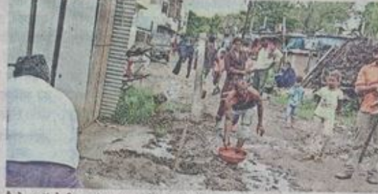
टैगोर कॉलोनी जहां प्रशासन ने पट्टे जारी कर दिए हैं।

रहवासियों ने जिला प्रशासन को की शिकायत में बताया कि उन्होंने अलकापुरी के पास टैगोर कॉलोनी में प्लॉट खरीदे थे। लेकिन प्रशासन ने उनके प्लॉट पर ही पट्टे जारी कर दिए। लोगों ने इस पर मकान भी बना लिए। हम जब लोगों के पास जाते हैं और बोलते हैं यह हमारा प्लॉट है आप यहां से हटो तो जवाब मिलता है कि हमें तो सरकार ने ही पट्टे दिए हैं और पट्टे दिखाने लग जाते हैं। जब प्रशासन ने ही हमें यहां बसाया है तो हम यहां से क्यों जाएं। इससे प्लॉटधारियों को अपना कब्जा नहीं मिल पा रहा है।