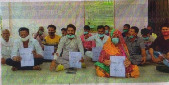
ग्राम कटाड़िया में टीकाकरण केंद्र के बहर बने पर बैठे ग्रामीण।

आज 12 स्थानों पर वैक्सीनेशन किया जाएगा शनिवार को शहर में अलकापुरी कन्वेंशनी हल अलकापुरी और डीआरएम आरिस्ट आफिसमें क्लब दो वती रतलाम पर कोविडगोल्ड ब्र केमल दूसरा होब लगाया जाएगा। अन्य केंद्रों में रामकला सभागृह लक्ष्मणपुर,