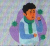
कोरोना पाजिटिव तथा शेष अन्य समस्याओं वाले हैं। मेडिकल कॉलेज के वीन ड. प्रिसेंट गुप्ता ने बताया कि मेडिकल कॉलेज से एक मरीज को

राजकीय मेडिकल कॉलेज रिजल्ट हॉस्पिटल में शुक्रवार की रिपोर्ट में केवल 17 फेरीट भी हैं। इनमें से बहर