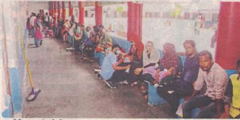
बाल चिकित्सालय में लगी भीड़।