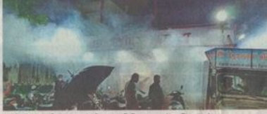
मलेरिया-डेंगू की रोकथाम के लिए बात चिकित्सालय में फार्मिंग करते हुए कर्मचारी।

मानव सेवा समिति के अनुसार एक अगस्त से 25 सितंबर तक 56 दिन में