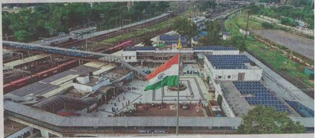
रतलाम में रेलवे परिसर की छत पर सोलर से बन रही बिजली।

केंद्र और राज्य शासन अपनी छतों से बिजली बनाने को प्रोत्साहित कर रही है। अपनी छत से बिजली बनाने और उस बिजली को स्टाइनों में प्रवाहित करने का जरिया नेट मीटरिंग होता है। नेट मीटर छत से बनने वाली बिजली और उपभोक्ता के घर, दुकान, फैक्ट्री की छत से उत्पादित होने वाली बिजली का हिसाब रखता है। यह हिसाब हर बिल में जारी होता है। यदि बिजली का उपयोग ज्यादा होता है, तो अंतर राशि का बिल जारी होता है। यदि छतों से बिजली उपयोग की तुलना में ज्यादा उत्पादित हुई तो अंतर यूनिट का बिल क्रेडिट जारी होता है। इस तरीके से बिजली उत्पादित करने वालों की संख्या धीरे-धीरे बढ़ती जा रही है। उज्जैन संभाग में लगभग सात सौ स्थानों पर छतों से बिजली उत्पादित की जा रही है। इसमें देवास जिले में 55 स्थानों से बिजली बनती है। इंदौर संभाग में दो हजार से ज्यादा स्थानों से बिजली का छतों के माध्यम से पैनल की मदद से उत्पादन हो रही है। मात्र में सबसे ज्यादा