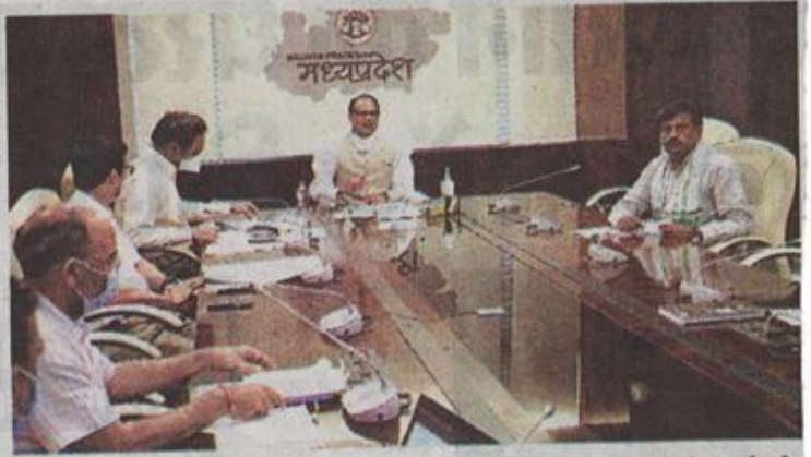
मुख्यमंत्री शिवराज सिंह चौहान ने भोपाल स्थित राज्य मंत्रालय में प्रगति ऑनलाइन पोर्टल अंतर्गत विकास की बड़ी परियोजनाओं में प्रगति की समीक्षा की।

मुख्यमंत्री चौहान मंत्रालय में प्रगति ऑनलाइन-13 में प्रोजेक्ट मैनेजमेंट प्रेम वर्क के तहत परियोजनाओं की समीक्षा कर रहे थे। चौहान ने कहा कि जन-कल्याण से जुड़े सार्वजनिक कार्यों में विलंब नहीं होना चाहिए। रीवा में सीवरेज स्कीम में मार्च 2017 में भूमि उपलब्ध करवा दी गई थी। कुल 199 करोड़ 73 लाख लागत की योजना में सिर्फ एक चौथाई निर्माण हुआ है। कार्य 2019 के अंत तक पूरा होना था। निर्माण एजेंसी ने पर्याप्त मात्रा में मैन पावर और मशीनरी का डिप्लॉयमेंट नहीं किया, जिसकी वजह से आमजन को समय पर सेवाएं नहीं मिल पाई। निर्माण एजेंसी को टर्मिनेशन के लिए पूर्व में शोकाज नोटिस भी दिया गया था। मुख्यमंत्री ने कहा कि जनता से जुड़े ऐसे कार्यों में ढिलाई बर्दाश्त नहीं की जाएगी।