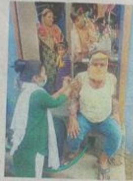
बाजना में प्रथम डोज से वंचित को घर जाकर टीका लगाती हुई स्वास्थ्यकर्मी।

27 सितंबर को आयोजित होने वाले टीकाकरण के लिए रतलाम शहर में कंकड़ मंत्रम गांधीनगर, रामकला सभागृह