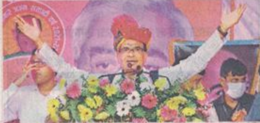
जनदर्शन के बाद सतना के कोठी में सभा को संबोधित करते सीएम।