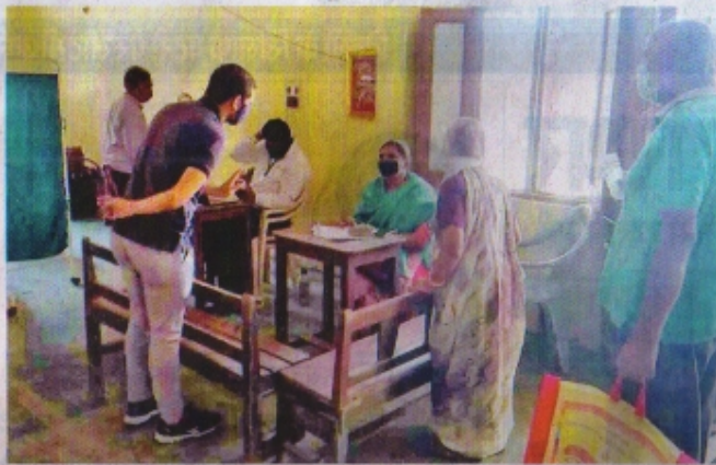
फारम्य रसागार में टीका लगाने के लिए फंजीयन कराते हुए हिताग्रही। • नईदुनिया 27/4/21

233 लोग स्वस्थ होकर घर लौटे कोरोना से संक्रमित 233 लोगों को सोमवार को स्वस्थ होने की खुशी मिली। इनमें स्वस्थ होने पर डिस्चार्ज किया गया। मेडिकल कॉलेज रतलाम से 37 व्यक्तियों को डिस्चार्ज किया गया। इसी प्रकार होम आइसोलेशन से 165 व्यक्तियों को निगेटिव रिपोर्ट आने के