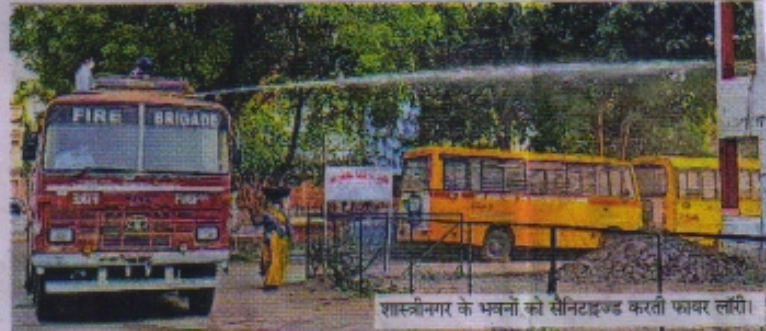
शास्त्रीनगर के भवनों को सैनिटाइज्ड करती फायर लॉरी।

नगर निगम लॉरी से लगभग 10 से 12 लाख लीटर सैनिटाइजर छिड़का जा रहा