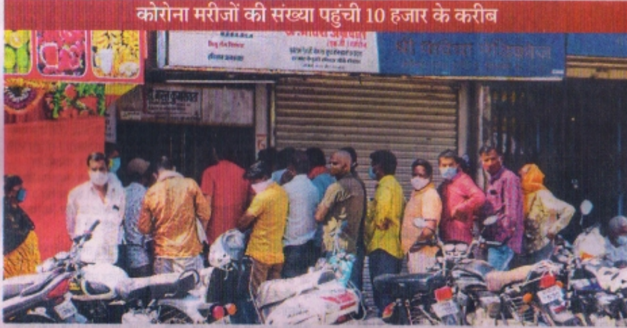
लोकेंव टॉकीज तिराहे पर संघालित निजी क्लीनिक पर लगी भीड़।

रतलाम, शहर के मेडिकल कॉलेज में अब नए मरीजों के लिए आईसीयू में जगह नहीं बची है। हालांकि सोमवार को 233 मरीजों की छुट्टी हुई है, लेकिन नए मरीजों के आने का ताता लगा हुआ है। यहां तक की शहर के निजी अस्पताल में जहां कोरोना का इलाज हो रहा था, वहां मरीजों को चबकर काटने पर रह रहे हैं। मेडिकल कॉलेज हॉस्पिटल से स्वस्थ होकर सोमवार को 37 व्यक्ति अपने घर लौटे। मेडिकल कॉलेज के डीन डॉ. जितेंद्र गुप्ता ने बताया कि सोमवार को मेडिकल कॉलेज में 58 नए मरीज भर्ती हुए। सोमवार की स्थिति में मेडिकल कॉलेज हॉस्पिटल में कुल बिस्तरों की संख्या 550, आईसीयू बेड 56 सभी फुल है। एचडीयू में 172 बेड सभी फुल हैं। ऑक्सीजन बेड 120 सभी फुल हैं। नॉन ऑक्सीजन बेड 202 में से 113 पर पेशेंट भर्ती हैं। कुल 461 पेशेंट हॉस्पिटल में भर्ती है इनमें 292 पॉजिटिव हैं तथा शेष सस्पेंडेट या ऑक्सीजन लेवल वाले हैं। कुल पॉजिटिव डैश 6 (5 रतलाम, 1 झाबुआ), हॉस्पिटल में रिक बेड 89 है। उन्होंने बताया कि मरीजों एवं उनके परिजनों को सभी सुविधाएं प्रदान करने के लिए किए जा रहे प्रयासों में निरंतर वृद्धि की जा रही है। मेडिकल कॉलेज से सोमवार को 37 व्यक्तियों को डिस्चार्ज किया गया। इसी प्रकार होम आईसोलेशन से 165 व्यक्तियों को नेगेटिव आने के उपरांत डिस्चार्ज किया गया। शर्मा हॉस्पिटल से 2 व्यक्ति को डिस्चार्ज किया गया।