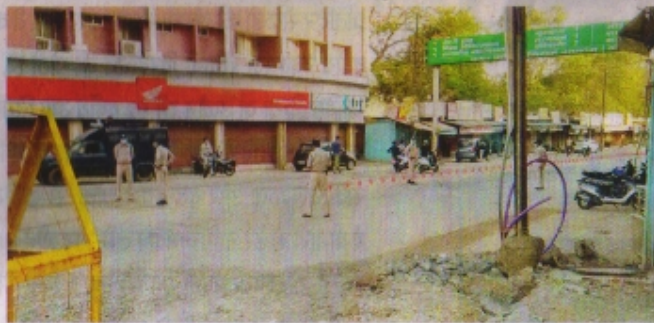
रतलाम के दो बनी चीराहा पर तेजात पुलिस जखन। • नईदुनिया

स्थित श्रद्धा हास्पिटल से तीन व्यक्ति को डिस्चार्ज किया गया। रेलवे हास्पिटल से चार व्यक्तियों, नवीन कन्या परिसर से तीन तथा अन्य सेंटर से 21 व्यक्तियों को डिस्चार्ज किया गया। डिस्चार्ज होने के बाद इन सभी ने खोबिड निदर्शों का पालन करने, अपने परिचितों, स्वजनों को मास्क लगाने, पर्यटन दूरी बनाए रखने के लिए प्रेरित करने का