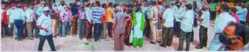
रतलम के अलकापुरी कम्यूनिटी हल पर वैक्सीनेशन के लिए लगी भीड़।

शत-प्रतिशत टीकाकरण वाला पहला गांव बना पंचेड़ महाअभियान के लक्ष्य में रतलम ग्रामीण क्षेत्र सबसे आगे है। यहाँ शनिवार तक तब लक्ष्य का 88.37 प्रतिशत टीकाकरण हुआ है। इसमें भी ग्राम पंचेड़ में सभी नागरिकों को टीके लगा चुके हैं। गांव में 18 वर्ष से 44 वर्ष के 2351 नामावली अनुसूचर मतदाता हैं जिनमें से 240 अपांग, मूतक, गर्भवती महिला या विवाह होने से बाहर चले गए हैं। शेष 2111 को टीका लगा चुका है। इसी प्रकार 45 वर्ष से अधिक के 1400 मतदाता में 220 अपांग को छोड़कर शेष 1180