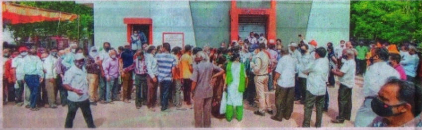
रतलाम के अलकापुरी कम्यूनिटी हल पर वैक्सीनेशन के लिए लंबी भीड़। • नईदुनिया

महाअभियान के लक्ष्य में रतलाम ग्रामीण क्षेत्र सबसे आगे है। यहां शनिवार तक तब लक्ष्य का 88.37 प्रतिशत टीकाकरण हुआ है। इसमें भी ग्राम पंचेड में सभी नागरिकों को टीके लगा चुके हैं।