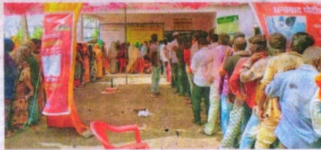
ग्राम बदनारा में टीकाकरण के लिए उमड़ी भीड़ ने शारीरिक दूरी के नियम को तार-तार कर दिया।