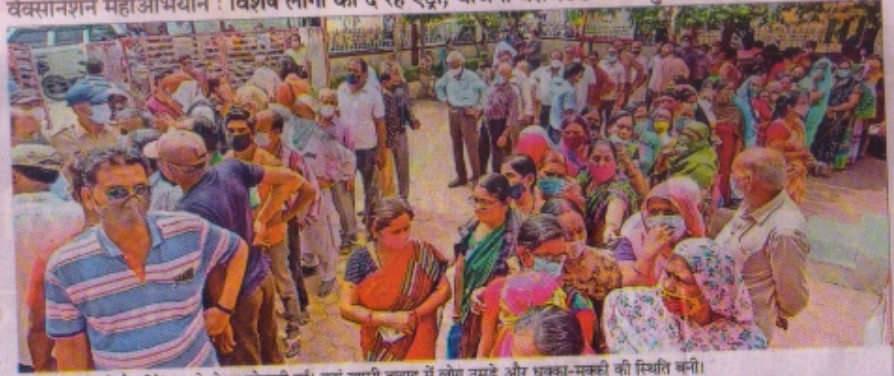
अलकापुरी में भी वैक्सीनेशन को लेकर परेशानी हुई। यहां खासी तादाद में लोग उमड़े और धक्का-मुक्की की स्थिति बनी।

वैक्सीनेशन महाअभियान : विशेष लोगों को दे रहे एंट्री, बाजना बस स्टैंड में भी पुलिस ने संभाली व्यवस्था