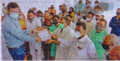
एसडीएम अभियांत्रिक गौहलौत को ज्ञापन सौंपते हुए कांसेरी।