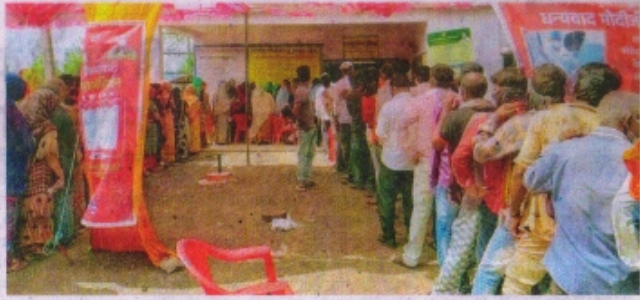
ग्राम बदनारा में टीकाकरण के लिए उमड़ी भीड़ ने शारीरिक दूरी के नियम को तार-तार कर दिया।