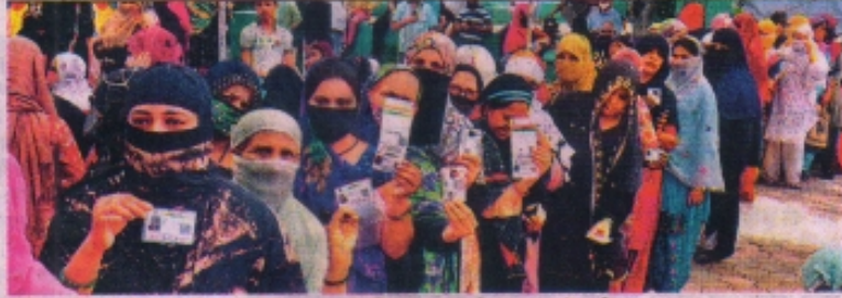
इंदौर. शनिवार को इंदौर में कोरोना टीकाकरण के लिए मतदान की तरह कतारें लगीं।