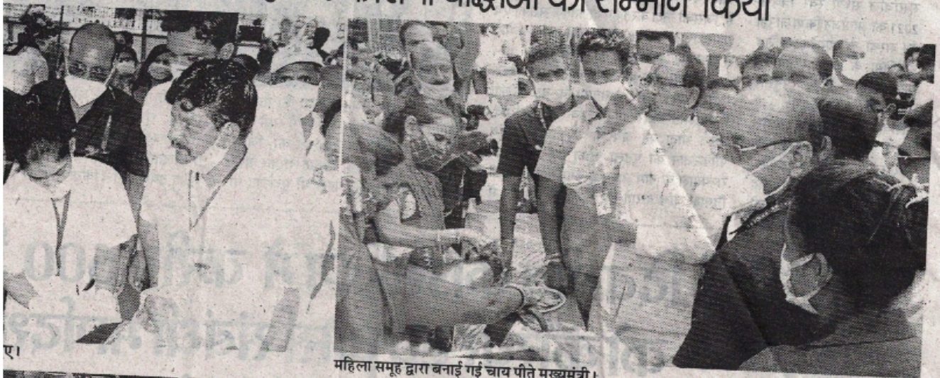
महिला समूह द्वारा बनाई गई चाय पीते मुख्यमंत्री।

महिलाओं की हौसला अफजाई कर कोरोना योद्धाओं का सम्मान किया