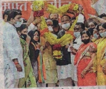
मुख्यमंत्री का अभिनंदन करते रहवासी।