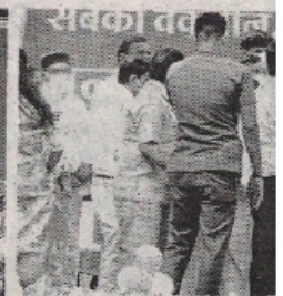
कोरोना योद्धा का सम्मान करते

अलकापुरी कम्प्यूनिटी हॉल में मौजूद ग्राम करमदी के तुलसी स्वयं सहायता समूह की महिलाओं कला