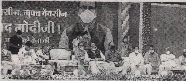
आयोजन को संबोधित करते सीएम चौहान।

को देखा तो उनके पाग नूंचे। वृद्ध महिला ने मोदीजी एवं शिवराजजी का धनवाद बोला। मुख्यमंत्री ने वृद्ध महिला के वैक्सीनेशन के लिए हॉल के अंदर से वैक्सीनेटर बुलवाए और वैक्सीनेशन करवाया।