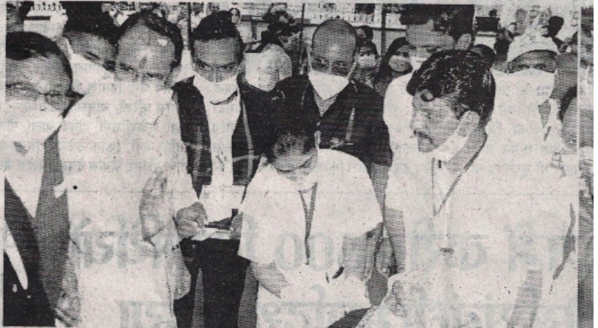
मुख्यमंत्री वृद्ध महिला का वैक्सीनेशन करवाते हुए।