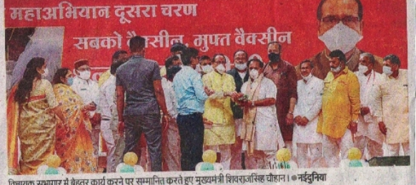
विधायक समूहगार में बेहतर कार्य करने पर सम्मानित करते हुए मुख्यमंत्री शिवराजसिंह चौहान।