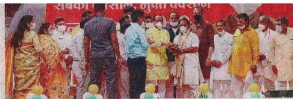
विधायक सभागार में बेहतर कार्य करने पर सम्मानित करते हुए मुख्यमंत्री शिवराजसिंह चौहान।