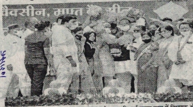
प्रचारण न्यूज़ • रतलाम