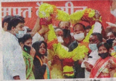
मुख्यमंत्री शिवराजसिंह चौहान सम्मान करते हुए नागरिक।

वैक्सीन लगवाने आए लोगों के हाथ पर लगाई सील