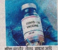
बाँच्य मंदसौर, नीमच, झाड़ुआ आदि आसपास के जिलेवासियों को भी कोरोना काल में उपचार के लिए मिला है।