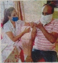
रेडक्रास भवन में कोरोना का दूसरा टीका लगाते युवक।