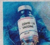
बलिक मंदरीर, नीमड, झाबुआ आदि आस्थास के जिलेवासियों को भी कोरोना काल में उपचार के लिए मिला है।

बरबड़ स्थित विधायक सभागृह में कोरोना वैक्सीनेशन में सहयोगियों के सम्मान समारोह में सीएम ने जनप्रतिनिधियों, राजनीतिक दलों के कार्यकर्ताओं, स्वयंसेवी संस्थाओं और आम नागरिकों सभी से आह्वान किया कि वे रतलाम जिले को शत-प्रतिशत वैक्सीनेटेड बनाने के महत्कर्मण कार्य में जुट जाएं। 31 दिसंबर तक शत-प्रतिशत लोगों को संकेड डोज भी लग जाए। सीएम ने कहा कि रतलाम में मंडिकल कॉलेज की स्थापना का लाभ न केवल रतलाम जिले