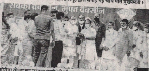
कोरोना योद्धा का सम्मान करते श्री चौहान।