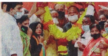
मुख्यमंत्री शिवराजसिंह चौहान का सम्मान करते हुए नागरिक।