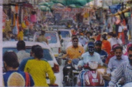
रतलाम में लॉकडाउन से पहले शनिवार को दिनभर शहर के लगभग हर हिस्से में कोरोना बाजार लगा। कहीं गहड़ लखन का पालन नगर नहीं आया। चित्र माणकचौक क्षेत्र का।

सख्ती के साइड इफेक्ट • लॉकडाउन से पहले उमड़ी भीड़