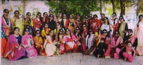
सम्बोदिया जैन मंदिर पर उपस्थित वीसा पोखवाल महिला संघटन की सदस्यिका।

मांग आता रही। रजिस्टर को होला पर लकड़ाने लगने से गाढ़वासी निराश भी है, हस्तान्तरित कोरोना संक्रमण रोकने के लिए लोग इसे जकड़ी भी मान रहे हैं। शनिवार को 1737 लोगों ने टीका लगाया शनिवार को जिले के 25 केंद्रों पर कुल 1737 लोगों ने कोविड का टीका लगाया। शहर के साल चिकित्सालय में कुल 490 और मेडिकल कालेज में कुल 214 लोगों का टीकाकरण किया गया। मुख्य चिकित्सा एवं स्वास्थ्य अधिकारी डा. प्रभाकर नन्कर ने बताया कि जिले में रजिस्टर को शासकीय अकाका होने, सोमवार को पुल्गेरी अकाका होने एवं मंगलवार को निगमित टीकाकरण संर होने के कारण कोविड का टीकाकरण नहीं हो सकेगा। राज्य स्वास्थ्य से प्रान्त निदेशानुसार आगामी समय में नगरीय निकायों के आम निवास 2011 में संतान अधिकारियों कर्मचारियों को कोविड का टीका लगाया जाएगा। इस संबंध में जिला निवासन कार्यलय से सम्बन्ध स्थापित कर टीकाकरण योजना तब बंद जाएगा। इसके लिए दुरुती में संलग्न कर्मचारियों का कोविड फेटील पर फंजीशन कर टीकाकरण किया जाएगा। चिकित्सा सुविधाओं में हस्तार की मांग शासकीय मेडिकल कालेज की सीनात जिनोबारियों के लिए स्वास्थ्य की दृष्टि