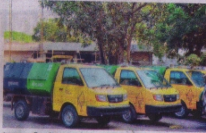
रतलाम नगर निगम के कचरा संग्रहण वाहन। ● फोटो फोटो

रतलाम (नईदुनिया प्रतिनिधि)। शहर की कचरा संग्रहण व्यवस्था में मानीटरिंग के लिए जीपीएस सिस्टम के साथ ही अब ट्रेडिंग ग्राउंड पर पहुंचने वाले कचरे का वजन भी किया जा रहा है। अब अगर बाढ़ों में कहीं कचरा उठाने में कोताही होती है तो वजन करने से भी प्रतिदिन की स्थिति स्पष्ट हो जाएगी। जिस दिन कचरे का वजन कम रहेगा, उस दिन संबंधितों से इसका कारण पूछकर लक्ष्यकारी करने वाले पर कार्रवाई भी की जा सकेगी। 25 से 27 जून तक तीन दिनों में कुल 250 टन कचरा ट्रेडिंग ग्राउंड पर पहुंचाया गया है।