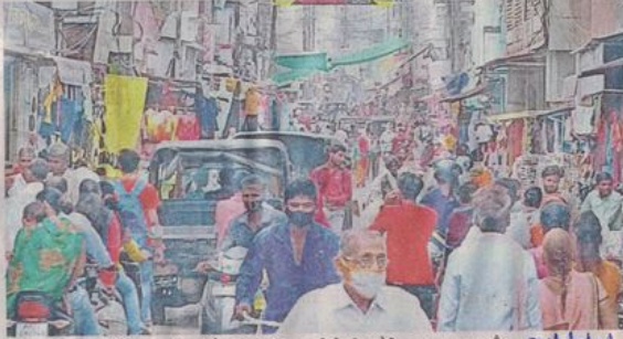
रतलाम के बाजार में भीड़ बढ़ने लगी है। इसे नियंत्रित करने के लिए ट्रैफिक प्लान बनाया है।

पुलिस ने शुरुआत चार पहिया वाहनों और कारों को बाजार क्षेत्र में आने से रोकने का प्लान बनाया है। भीड़ बढ़ी तो दो पहिया वाहनों का प्रवेश भी माणकचौक क्षेत्र में रोक दिया जाएगा। गुरुवार-शुक्रवार को पुष्प नक्षत्र की भीड़ देखने के बाद ट्रैफिक पुलिस प्लान अपडेट करेगी।