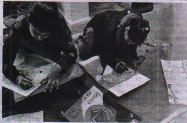
बच्चों सीख दे रहे.