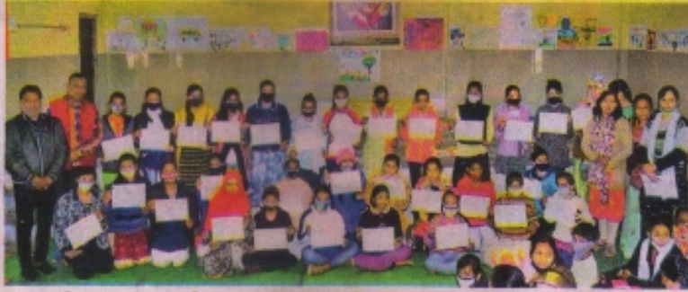
स्वच्छता सर्वेक्षण 2021 के तहत गांधी नगर आम्बेडकर हॉल में आयोजित विभिन्न प्रतिभागिता की विजेता बालिकाएं।

स्वच्छता सर्वेक्षण 2021 के तहत शहर के गांधी नगर स्थित आम्बेडकर