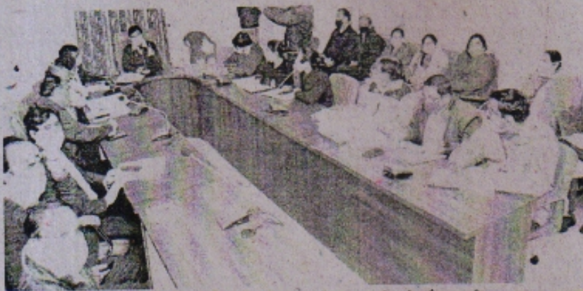
प्रस्ताव न्यूज • रतलाम