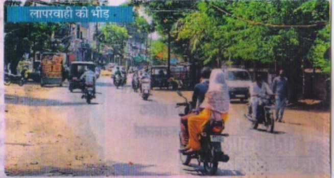
लापरवाही की भीड़