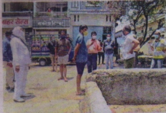
लकड़पीठा नाले की स्थिति देख रहवासियों से आयुक्त झारिया ने जात की।

आश्वासन दिया : जल्द शुरू होगा बोहरा बाखल के अधूरे नाले का काम