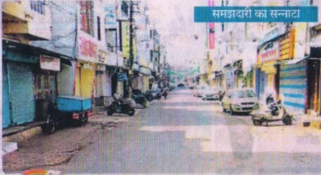
समझदारी का सन्नाटा