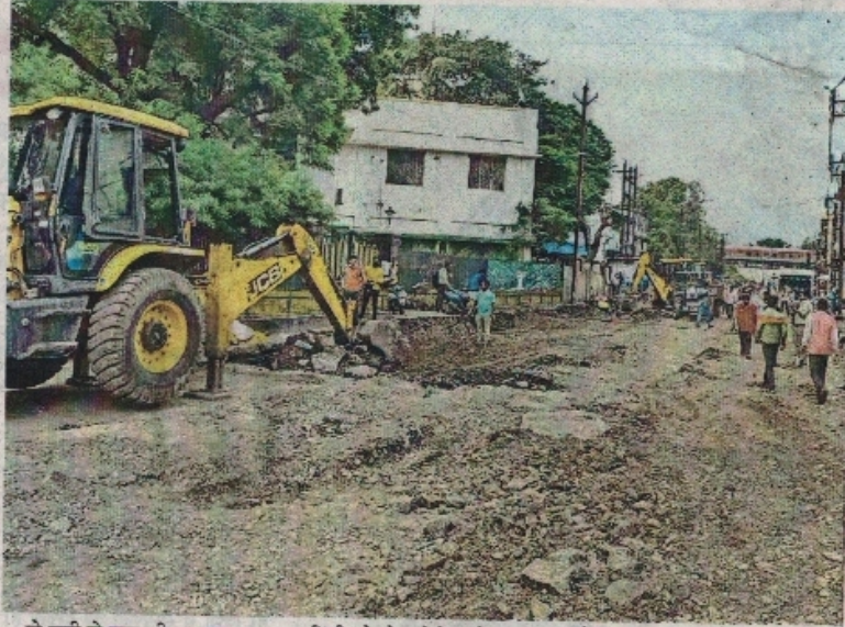
दो बत्ती से डाट की पुल तक का काम सिटी फोरलेन प्रोजेक्ट के तहत जारी है।

रतलाम | सितंबर में सैलाना बस स्टैंड से कॉन्वेंट तिराहा तक 1720 मीटर लंबा सिटी फोरलेन बनकर तैयार हो जाएगा। वर्तमान में कॉन्वेंट स्कूल तिराहा से महाराजा सज्जन सिंह चौराहा तक के 720 मीटर लंबा फोरलेन बनाने का काम चल रहा है। इसमें भी कॉन्वेंट स्कूल से सब्जी मंडी तक लगभग 550 मीटर का सीमेंट कांक्रीट हो चुका। अगले 10 से 12 दिन में सीसी वर्क चौराहा तक पूरा हो जाएगा। इधर दो बत्ती चौराहा से डाट की पुल तक टू लेन निर्माण पूरी रफ्तार से चल रहा है। यातायात बंद होने से ठेकेदार को बेस तैयार करने में परेशानी नहीं आ रही है। काम इसी तरह चलता रहा तो एक सप्ताह में आधार तैयार होने के बाद सीसी वर्क शुरू हो जाएगा। कलेक्टर कुमार पुरुषोत्तम के समय सीमा के अनुसार काम तेजी से करवाने के लिए कमिश्नर सोमनाथ झारिया खुद इंजीनियरों से डेली अपडेट लेकर मॉनीटरिंग कर रहे हैं। आयुक्त झारिया ने बताया अब काम सड़क पूरी बनने के बाद ही रुकेगा। ठेकेदार को स्पष्ट निर्देश दे दिया गया है।